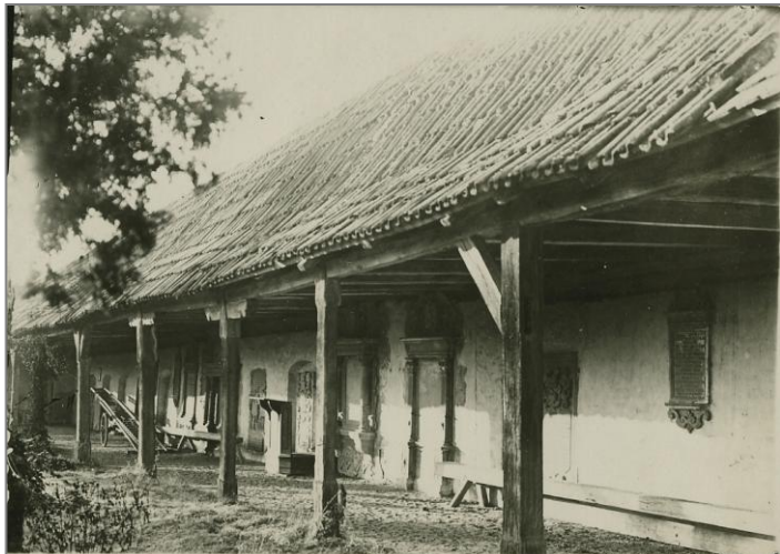
Die Segnitzer Friedhofsarkaden um 1950 mit dem hölzernen Predigtstuhl. Im Jahr 2017 wurden die Arkaden und das Bahrhäuschen mit Fördermitteln der Dorferneuerung renoviert.

Böse Zungen behaupten, dass der Name „Segnitz“ vom lateinischen „segnitia“ für Trägheit, Langsamkeit herrührt. Dass das nicht zutreffen kann, haben die Segnitzer in ihrer 875jährigen Geschichte ausreichend bewiesen. Einer neueren Version folgend könnte man „segnitia“ aber auch mit Stille oder Ruhestätte deuten. Dies würde immerhin zu den beiden bislang auf Segnitzer Gemarkung gefundenen Gräberfeldern aus prähistorischer Zeit passen.