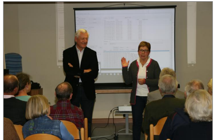
Ein volles (Gemeinde-) Haus gab es auch beim Filmvortrag über den Landkreis Kitzingen um 1960 und einer aktuellen Luftbildschau von Richard Scharnagel.

Was sich bis heute so alles verändert hat, zeigte Richard Scharnagel im Anschluss an den Film anhand aktueller Luftbilder. Schwerpunkt waren dabei Segnitz und Marktbreit von oben. Der Film- und Bilderabend ergänzte die Segnitzer Vortragsreihe mit den bisherigen Themen erste Franken im Maindreieck, erste Erwähnung von Segnitz, die Protestantischen Union und Landjuden in Unterfranken.