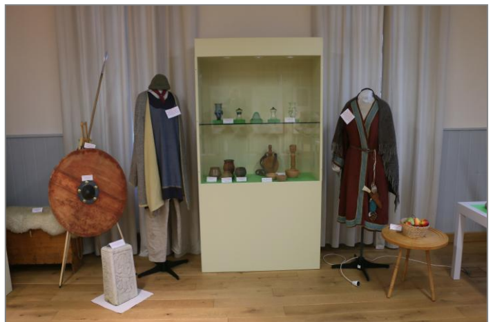
Die ersten Franken am Maindreieck war Thema einer Ausstellung im Mehrzweckraum in der alten Schule. Dort zeigte die Reenactmentgruppe „Merowingerzeit“ Nachbildungen von Waffen, Schmuck und Geräten aus der Zeit als die Franken das Maingebiet eroberten und besiedelten.

Neben der Sonderausstellung im Museum stehen eine ganze Reihe, über das Jubiläumsjahr verteilte, Vorträge, Film- und Bilderschauen sowie Beiträge der Vereine auf dem Programm. Im Mittelpunkt steht dabei auch ein Dorffest mit dem Thema „Durch Garten, Dorf und Keller“ mit Führungen in Gärtnereien, beim Winzer und im Dorf. Den Abschluss des Festreigens bildet der „Flurgang anno dazumal“, ein Gemarkungsumgang der Feldgeschworenen nach alter Sitte.