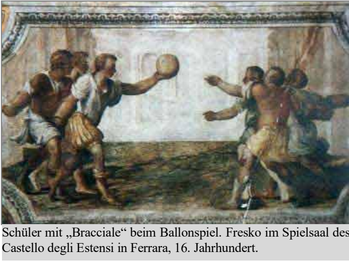
Schüler mit „Bracciale“ beim Ballonspiel. Fresko im Spielsaal des Castello degli Estensi in Ferrara, 16. Jahrhundert.

Segnitz und Faustball gehören zusammen - vielmehr: „Segnitz ist Faustball“. Schließlich nimmt dieser Sport im Gärtner- und Winzendorf bereits seit mehr als 100 Jahren eine besondere Stellung ein. Damit spielt der Turnverein Segnitz und sein Faustball natürlich auch im 875. Jubiläumsjahr des Ortes eine große Rolle. Ein Faustballabend am 27. Juli mit Gästen aus Brasilien und Nationalspielern aus Schweinfurt-Oberndorf stellte zusammen mit dem Segnitzer Nachwuchs den modernen Faustball vor.