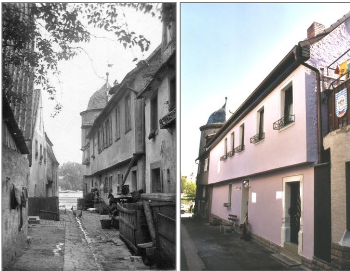
Die Synagoge der ehemaligen Segnitzer Kultusgemeinde in der Linsengasse um 1940 und heute. 1897 wurde sie an privat verkauft und 1979 gründlich aus- und umgebaut. Einzig die Spur einer Schriftkapsel (Mesusa) erinnert noch an die einstige religiöse Bedeutung des Gebäudes.