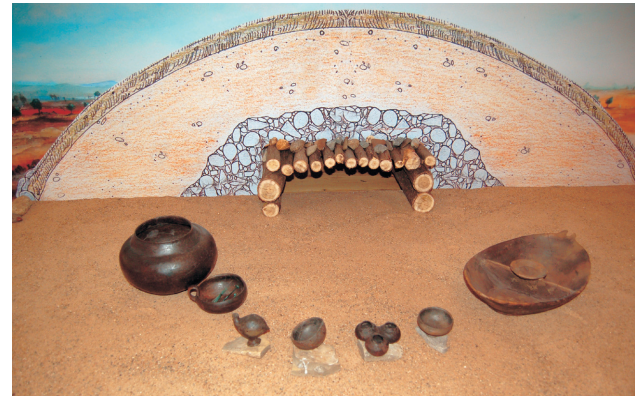
Schnitt durch einen hallstattzeitlichen Grabhügel mit zum Bestattungsritual gehörenden Gefäßen und Vogelklapper (um 700 v. Chr.)

In einem neuen Museumsraum im Dachgeschoss der alten Schule werden anhand von inszenierten Grabungsbefunden die Bestattungssitten von der Jungsteinzeit bis ins Frühe Mittelalter exemplarisch vor Augen geführt.