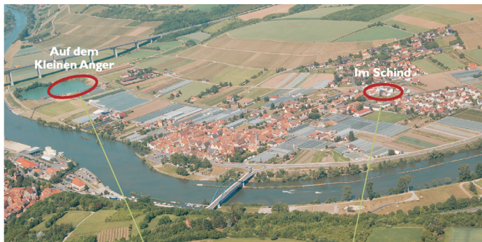
Das Gräberfeld auf dem "Kleinen Anger" Das Gräberfeld "im Schind"

Blick auf Segnitz mit Lage der zwei Gräberfelder: