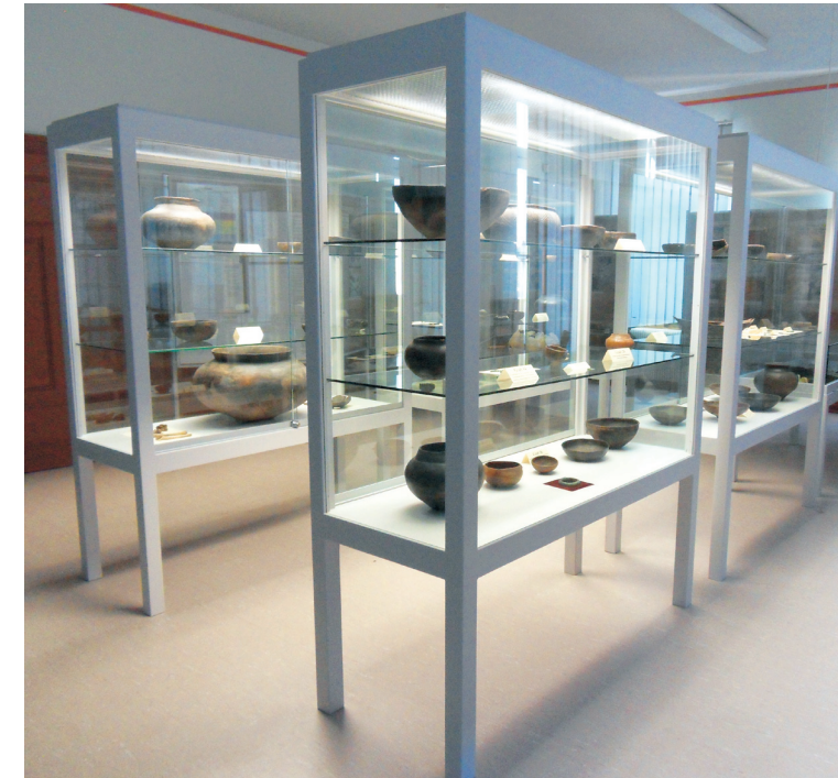
Vitrinen mit Funden vom Kleinen Anger

Im schon länger bestehenden Museumsraum im Obergeschoss sind hauptsächlich Funde vom Hallstattgräberfeld zu bewundern.